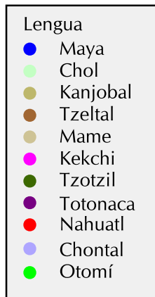
Mapa B.35. Campeche: localidades indígenas* con más de dos viviendas según lengua indígena predominante, 2000